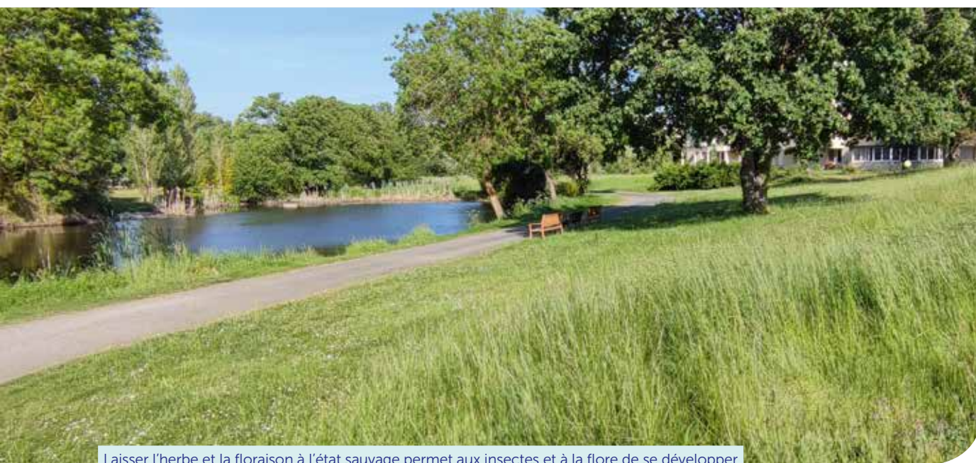
Laisser l'herbe et la floraison à l'état sauvage permet aux insectes et à la flore de se développer

Au mois de juin, les 3 hectares concernés par la gestion différenciée des espaces seront fauchés. Le foin récupéré sera donné à une association. La faune et la flore auront en effet été préservées.