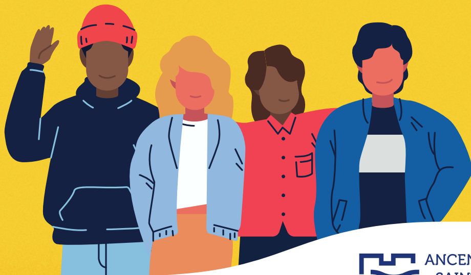
Illustration © Adobe stock