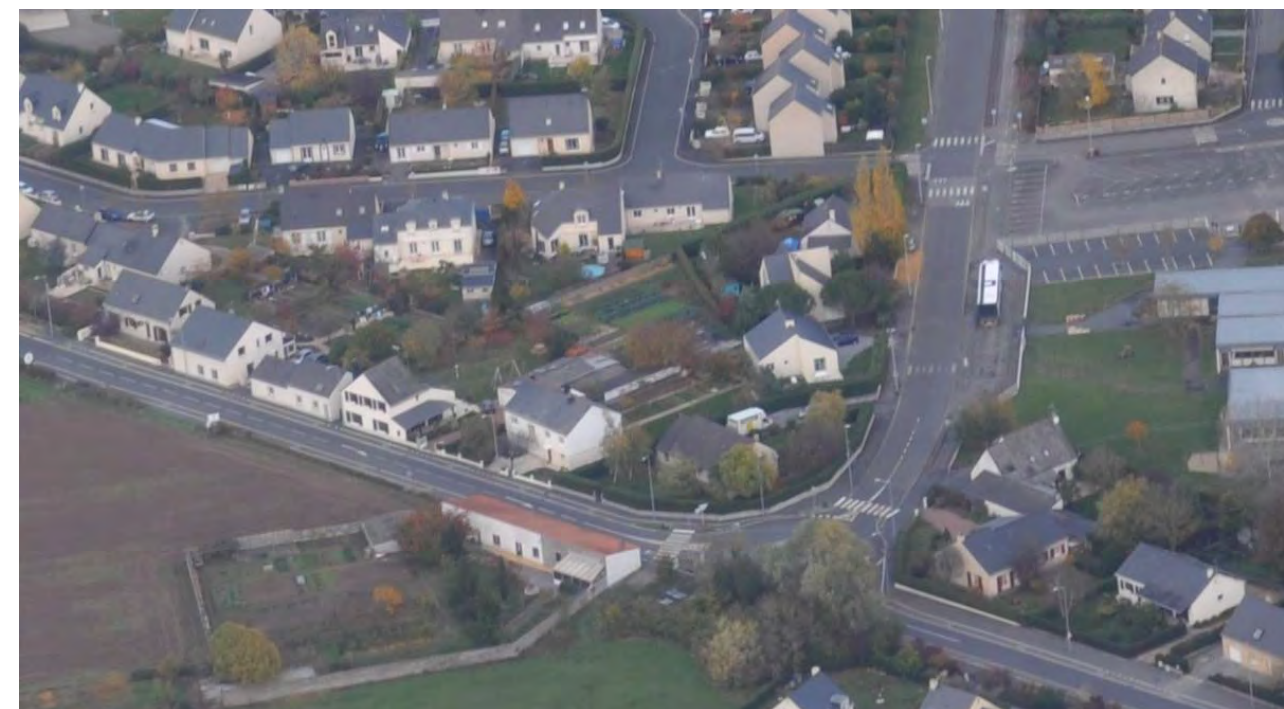
VUE AERIENNE (2010)