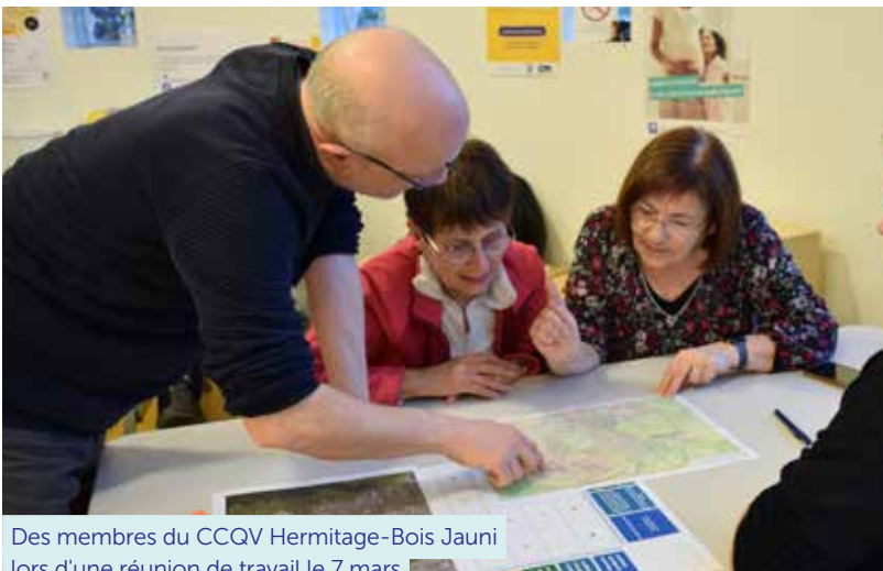
Des membres du CCQV Hermitage-Bois Jauni lors d'une réunion de travail le 7 mars

* Avec le soutien financier de l'ADEME et du Département.