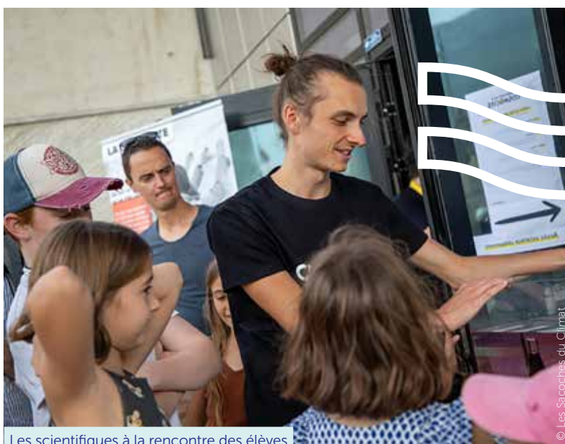
Les scientifiques à la rencontre des élèves

autour des enjeux climatiques. Si les gens n'ont pas de questions particulières, on déclenchera la parole par un discours pragmatique, en partant de la vie quotidienne. » Pour créer ce dialogue avec le public, l'équipe des Sacoques s'appuiera sur une exposition sur la solastalgie, ce sentiment de voir disparaître son environnement. Une exposition pédagogique et poétique qui s'appuie sur les photographies de Jean Lavigne, les textes de Christophe Cassou, chercheur en sciences du climat de renommée internationale, et des dessins de presse.