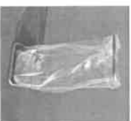
Support de housse 110 L, 400 L, 1400 L