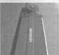
Compacteur monobloc 20 m³ et palette fixe 30 m³