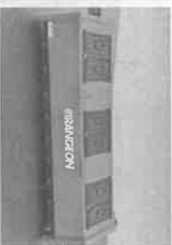
Caisson à volets 20 m³