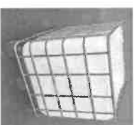
Cuve 1 000 L