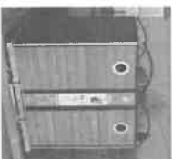
Colonne à verre 2 m³, 3 m³, 4 m³