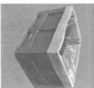
Caisse palette 543 L