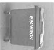
Boc 4 roues de 400 L à 770 L