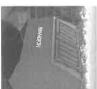
Ecoboc 2,5 m³, 5 m³ et 10 m³