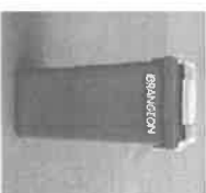
Boc 2 roues de 120 L, 140 L, 180 L, 340 L