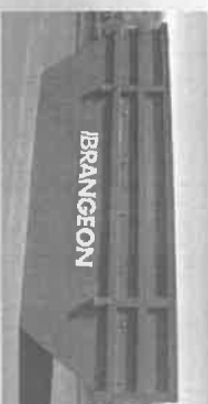
Caisson multi 10 m³ certifié grutable