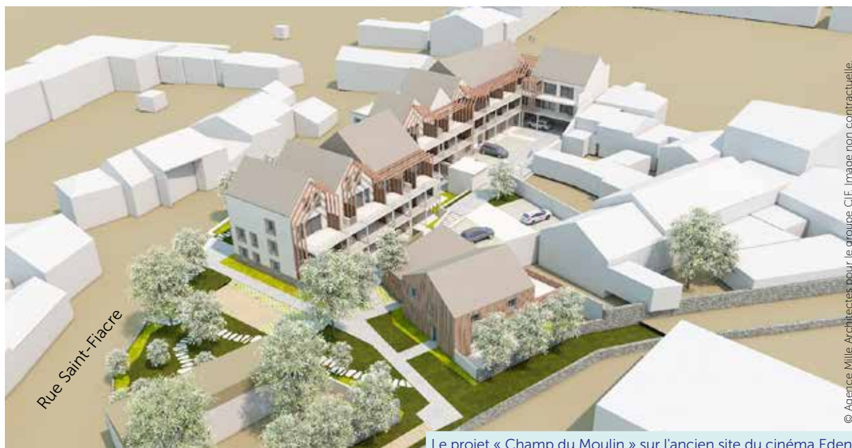
Le projet « Champ du Moulin » sur l'ancien site du cinéma Eden

se situer sous un plafond de ressources. Grâce au concours de l'OFS Atlantique Accession Solidaire, les prix de ces nouveaux logements devraient se situer de 30 % à 50 % en deçà des valeurs du marché. Le permis de construire devrait être déposé en cette fin d'année.