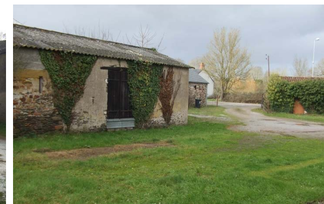
le chemin à condamner