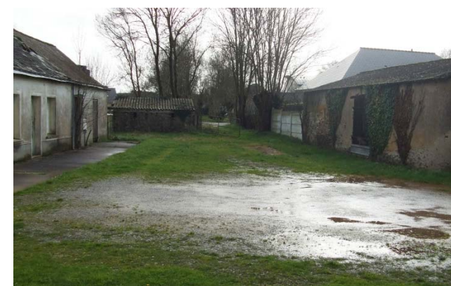
l'axe du chemin carrossable à créer et l'annexe à préserver