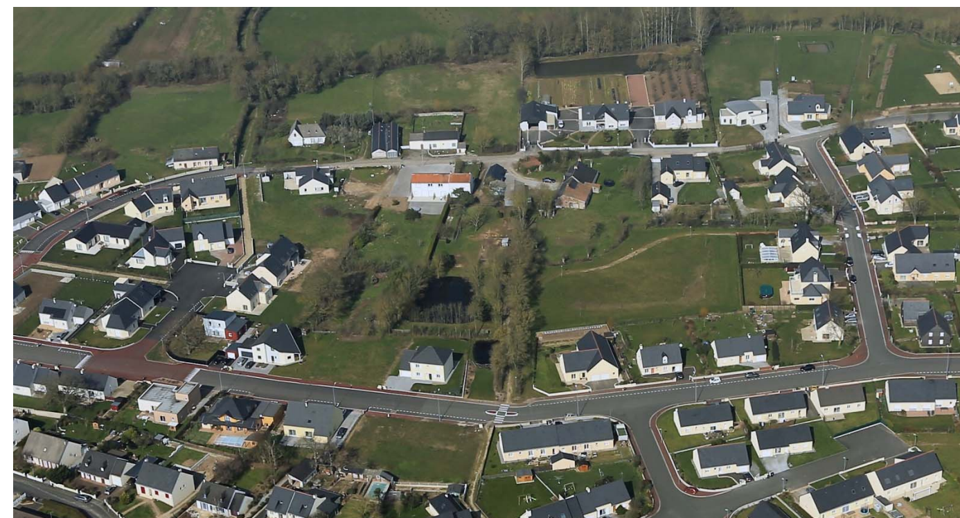
VUE AERIENE (2013)

Préserver les éléments du paysage : maille bocagère, mare existante.