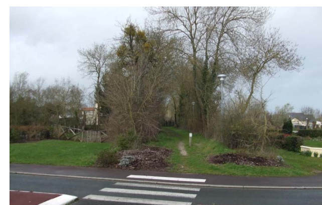
Le chemin pédestre depuis l'av du Roussillon