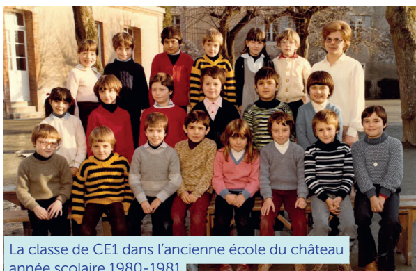
La classe de CE1 dans l'ancienne école du château année scolaire 1980-1981

La ville prépare une exposition sur le château.