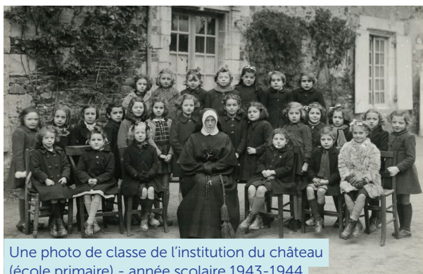
Une photo de classe de l'institution du château (école primaire) - année scolaire 1943-1944

Vous avez des photos, films, objets, témoignages ou anecdotes... ? Complétez le formulaire en ligne sur ancienis-saint-gereon.fr ou contactez le service communication au 02 40 83 86 83. Des membres des conseils des habitants reviendront vers vous.