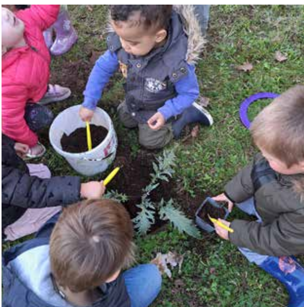
Les enfants de la maternelle M me de Sévigné découvrent le potager