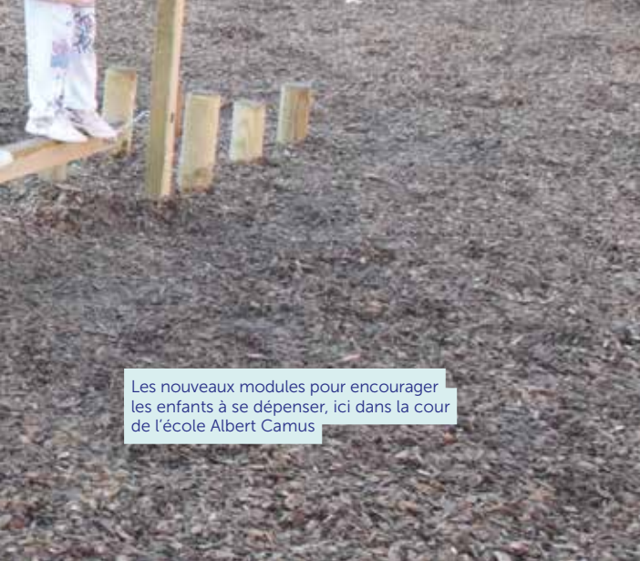
Les nouveaux modules pour encourager les enfants à se dépenser, ici dans la cour de l'école Albert Camus