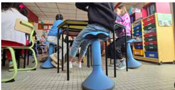
Dans une classe de CM1-CM2 de l'école élémentaire M me de Sévigné, le mobilier traditionnel a été remplacé par du mobilier « flexible »

Pour équiper ces classes, l'école a bénéficié d'une dotation de l'État de 24 000 € et d'un financement de la ville à hauteur de 4 000 €. L'objectif est d'équiper progressivement toutes les classes de l'école.