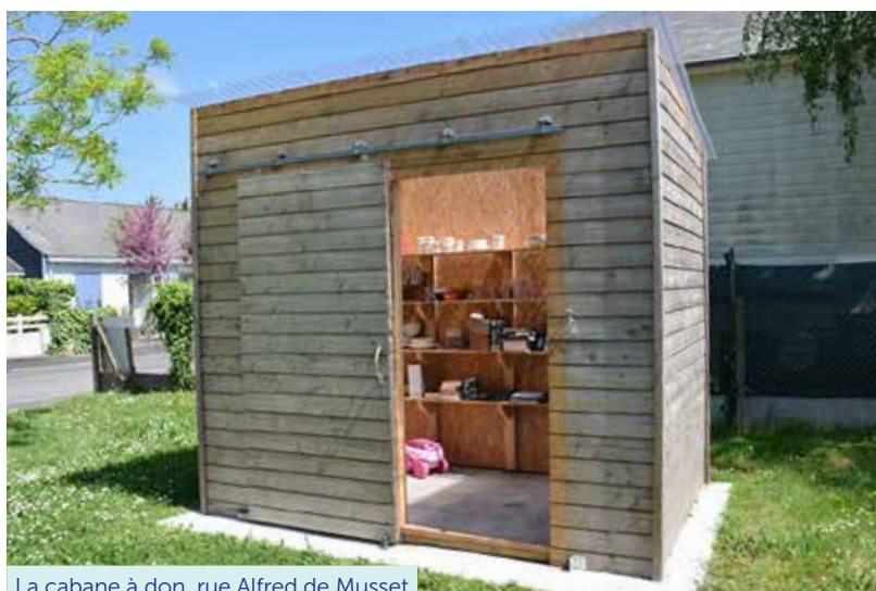
La cabane à don, rue Alfred de Musset

La cabane à dons, créée dans le cadre du budget participatif de la ville sur une idée de l'Amicale Sainte-Anne-La Mariolle, est désormais en fonction. Chacun-e peut y déposer des petits objets (vêtements, jouets, vaisselle, livres, etc.) dont il n'a plus l'usage mais qui peuvent encore servir à d'autres, et y prendre ce dont il a besoin. C'est également un lieu d'échange, de rencontres pour les habitants et habitantes. Cette cabane se situe sur l'espace enherbé de la rue Alfred de Musset. Elle est ouverte les samedis et dimanches de 10h à 19h.