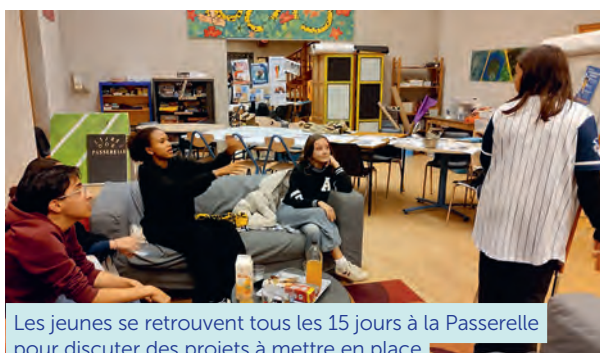
Les jeunes se retrouvent tous les 15 jours à la Passerelle pour discuter des projets à mettre en place

Les réunions pour discuter et organiser les projets se déroulent le mercredi tous les 15 jours de 17h30 à 19h à la Passerelle . Les réunions sont pilotées par Dolorès, animatrice jeunesse. Les jeunes peuvent y venir librement.