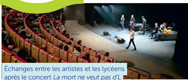
Échanges entre les artistes et les lycéens après le concert La mort ne veut pas d'L

Les séances scolaires sont destinées en priorité au public scolaire, mais ouvertes à tous dans la limite des places disponibles. Réservation auprès de la billetterie, sur place ou par téléphone aux horaires d'ouverture. Tarif unique : 8,00 € Tél. 02 51 14 17 17