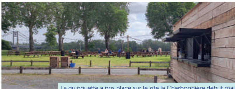
La guinguette a pris place sur le site la Charbonnière début mai

La guinguette estivale, habituellement installée au Jardin de l'Eperon, a pris exceptionnellement place à la Charbonnière, entre la piscine découverte et les terrains de tennis, en accord avec le bar-restaurant La Charbo. L'équipe de la guinguette proposera des animations tout l'été.