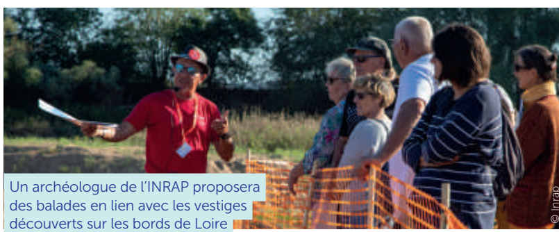
Un archéologue de l'INRAP proposera des balades en lien avec les vestiges découverts sur les bords de Loire

Le service culture de la ville a concocté un programme d'animations culturelles jusqu'en octobre, en lien avec l'exposition au château d'Ancenis. Parmi ces animations, une balade archéologique est organisée à l'occasion des Journées européennes de l'archéologie.