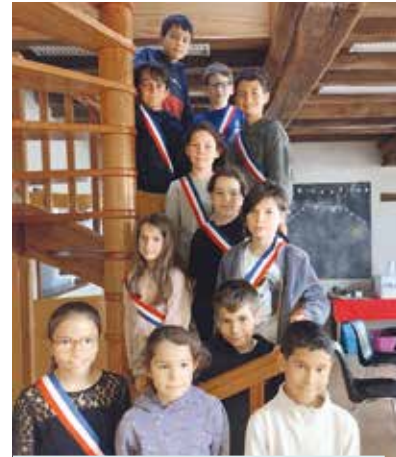
Les élus du Conseil Municipal Enfants

organiser vos déplacements, les sites officiels de la SPA ( la-spa.fr ) ou de la Fondation 30 millions d'Amis ( 30millionsdamis.fr ) regorgent de conseils et d'adresses adaptées.