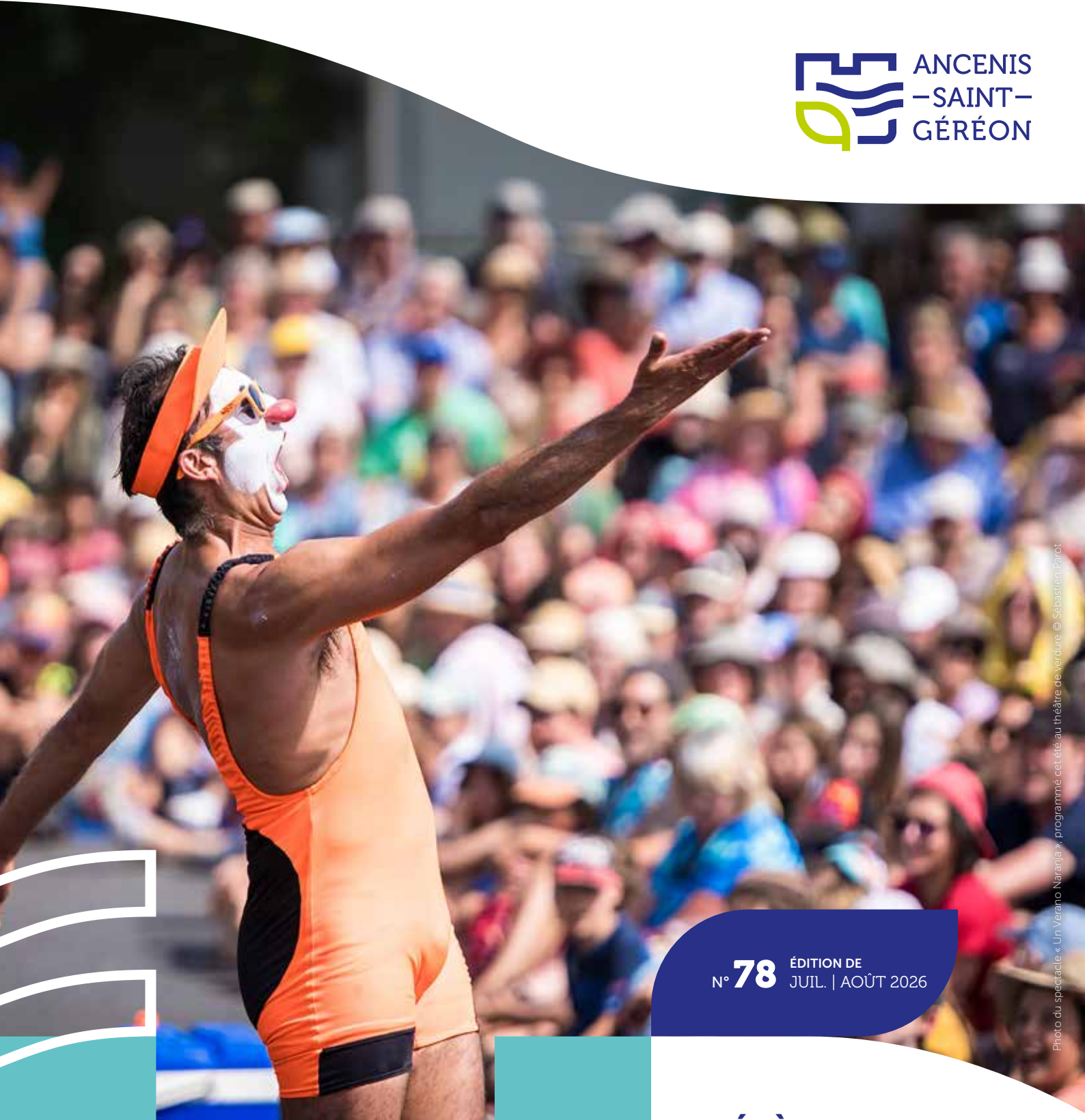
Photo du spectacle « Un Verano Naranja », programmé cet été au théâtre de verdure.