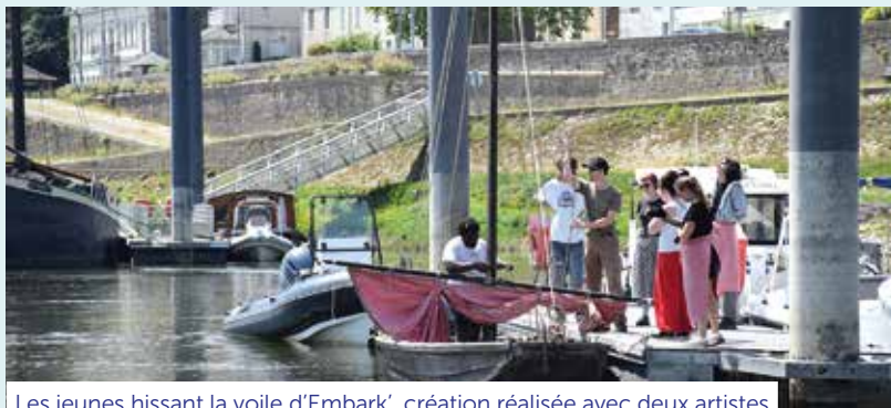
Les jeunes hissant la voile d'Embarck', création réalisée avec deux artistes

d'apprentissage en collectif, de fabrication à plusieurs mains. Les jeunes ainsi que leurs proches et les partenaires ont pu partager un moment convivial.