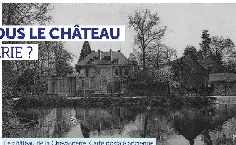
Le château de la Chevasnerie. Carte postale ancienne

Du côté de la route de Nort-sur-Erdre se dresse la Chevasnerie dit « château de la Chevasnerie ». Cette propriété, construite en 1791 et dont les fondements remontent au xv e siècle, est un élément emblématique du patrimoine historique de Saint-Géréon et indissociable de l'histoire de la seigneurie de la Chevasnerie. Jusqu'en 1880, il faut imaginer que le paysage alentour était principalement constitué de vignes à l'ouest de la route de Nort depuis la ferme du château jusqu'à la Dabotière, où elles furent progressivement dévastées par les