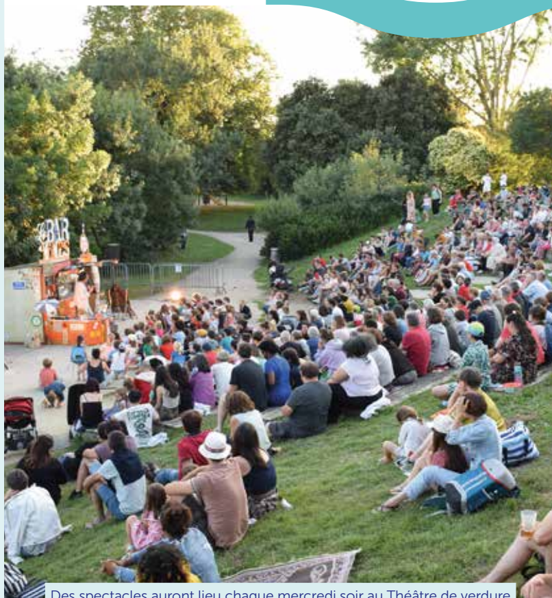
Des spectacles auront lieu chaque mercredi soir au Théâtre de verdure

Retrouvez le programme joint à ce bulletin ainsi que sur www.ancenis-saint-gereon.fr