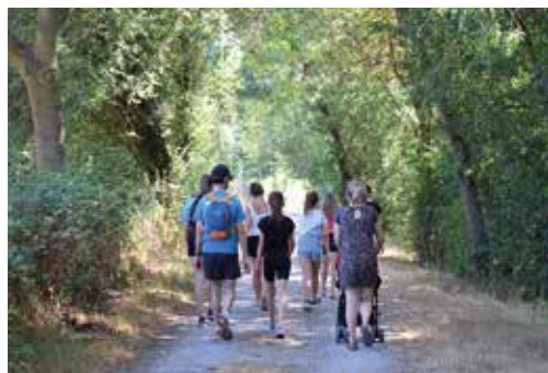
Les plans des randonnées sont disponibles sur ancenis-saint-gereon.fr ou à l'Espace Tourisme et Loisirs.

Petite boucle de 3 km idéale en famille pour découvrir les bords de Loire.