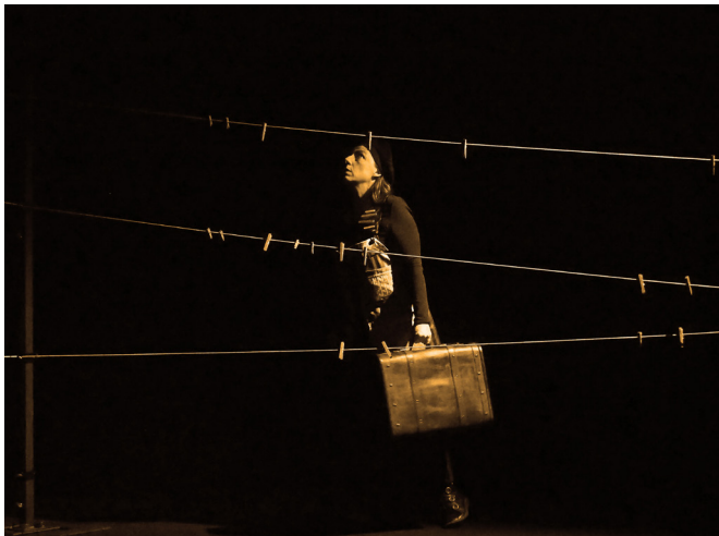
© ...Comme l'air - Erika Le Gallou

C'est l'histoire dans l'Histoire. Celle de la transmission de Zdenek Taussig, un petit garçon devenu un vieux monsieur. Un vieux monsieur qui n'a jamais pu raconter son passé. Avant de s'éteindre il demande à Claire, sa voisine, de devenir sa voix et de transmettre son histoire, son terrible secret. Emprunter des chemins tendres et poétiques pour raconter l'indicible. L'histoire dans l'Histoire : celle d'un groupe d'enfants juifs du camp de Terezin en 1943 qui, pour tromper la peur, créent une république clandestine et un journal clandestin.