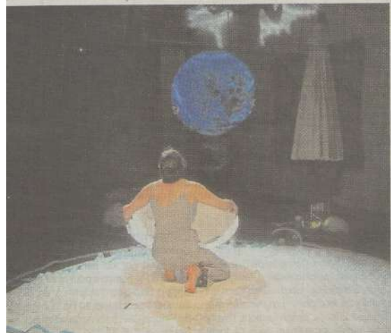
Un moment de poésie et de magie.

Un spectacle à partager avec les moins de 3 ans