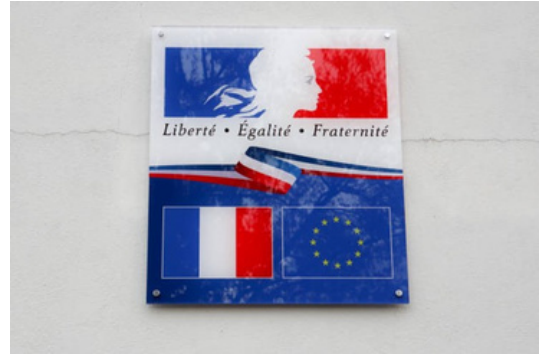
La devise “Liberté, égalité, fraternité”