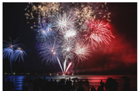
Le 14 juillet