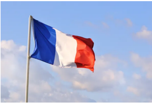
Le drapeau tricolore