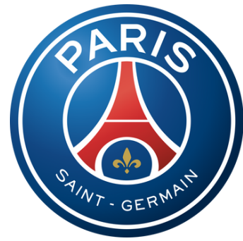
L'écusson du PSG