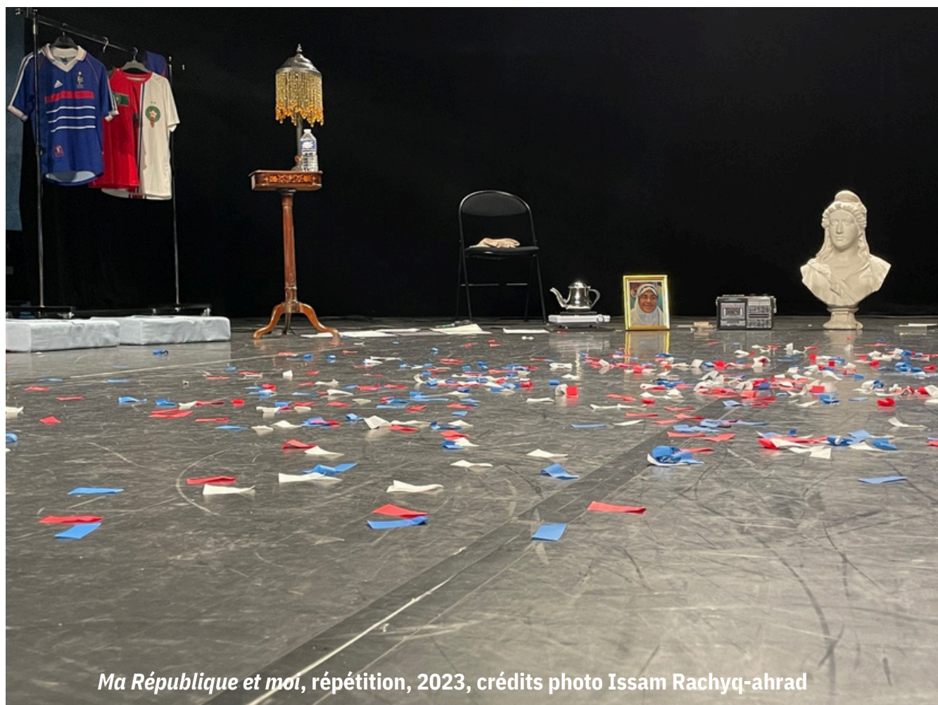
Ma République et moi, répétition, 2023

Dans l'image ci-dessous, retrouver les symboles de la République. De quelle couleur sont les confettis à la fin du spectacle ? Pourquoi ?