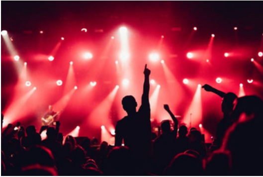
“Allumez le feu” de Johnny Halliday