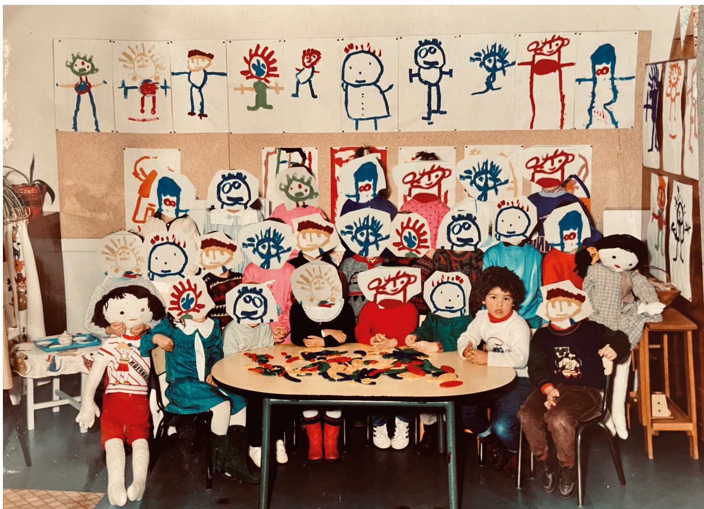
Ma République et moi , affiche du spectacle, crédits photo Alexandre Slyper

Quel lieu est-il figuré sur l'affiche ? En quoi peut-il être considéré comme un emblème de la République ?